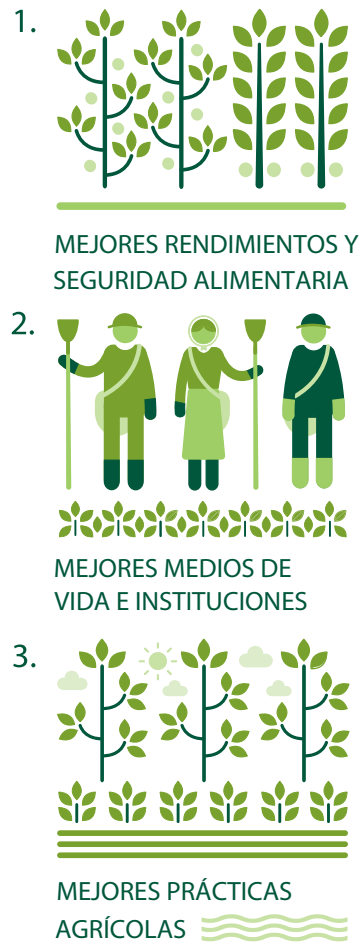
Figura 1: Pilar 2 Apoyo a los pequeños productores